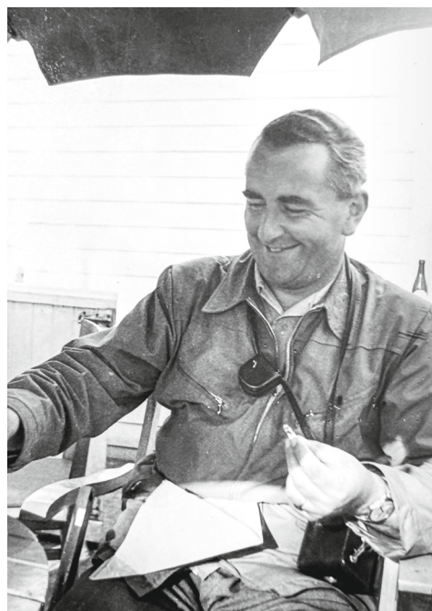
Emil Brunner, Tromsø 1953, Foto: Rolf Heyne «Telegrafenucht» © Fotostiftung Schweiz, Sammlung Hugger

fasst verschiedene Erlebnisräume: Im BSINTI-Ausstellungsraum für alpine Fotografie werden Bilddokumente aus Brunners Schaffen als reisender Foto-reporter und Bergsteiger präsentiert, während entlang der Spazierwege 30 Stationen mit berührenden Kinderporträts Einblick in den damaligen Kinderalltag von 1943/44 geben.